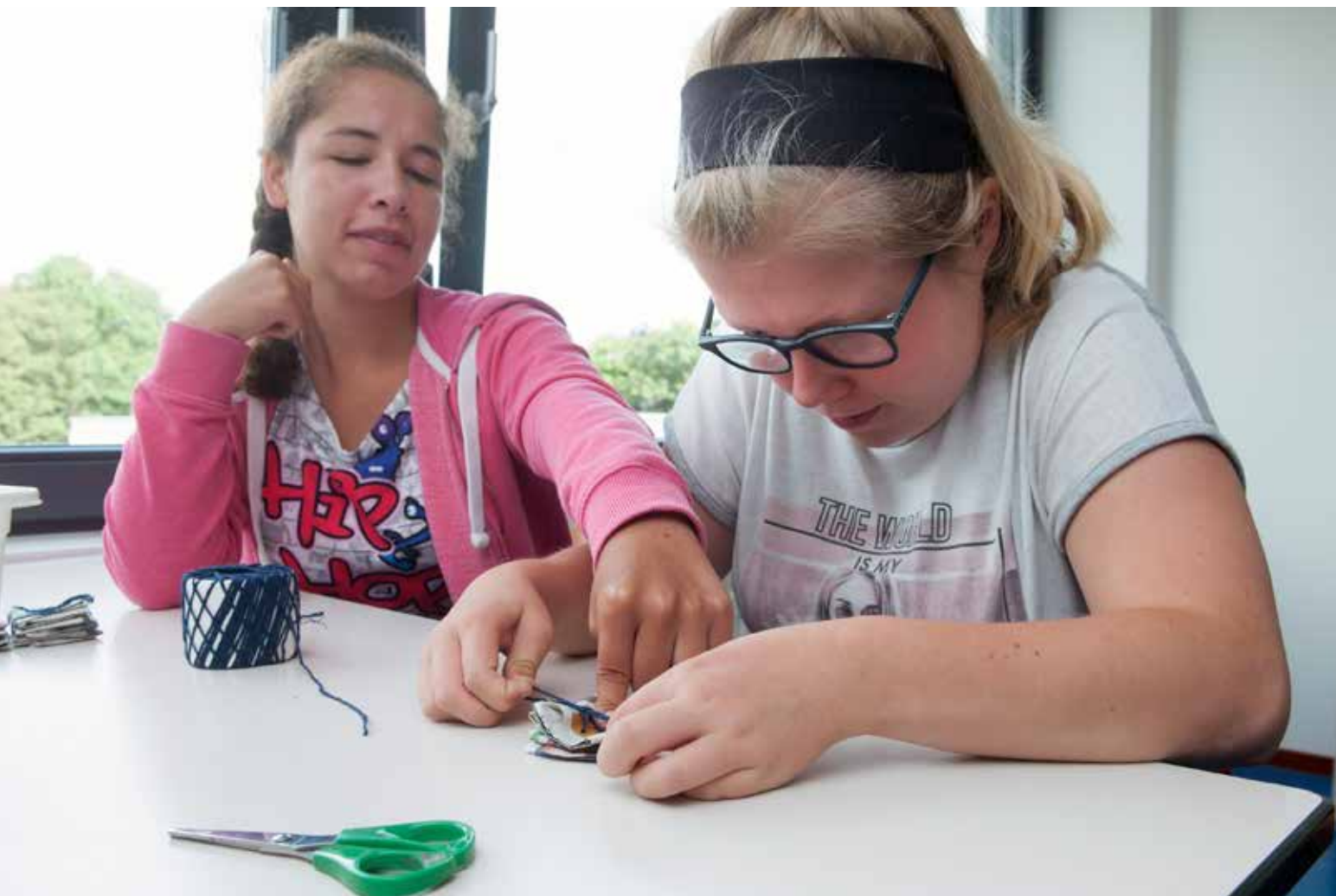
De foto's op pagina 9 t/m 11 zijn gemaakt op VSO Maarland